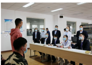
校领导巡察专业面试情况

春天是出发的季节，也是播种的季节，愿广大考生历尽千帆，在工院圆梦成才！