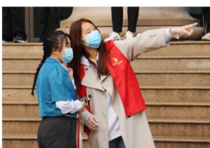
志愿服务周到细致