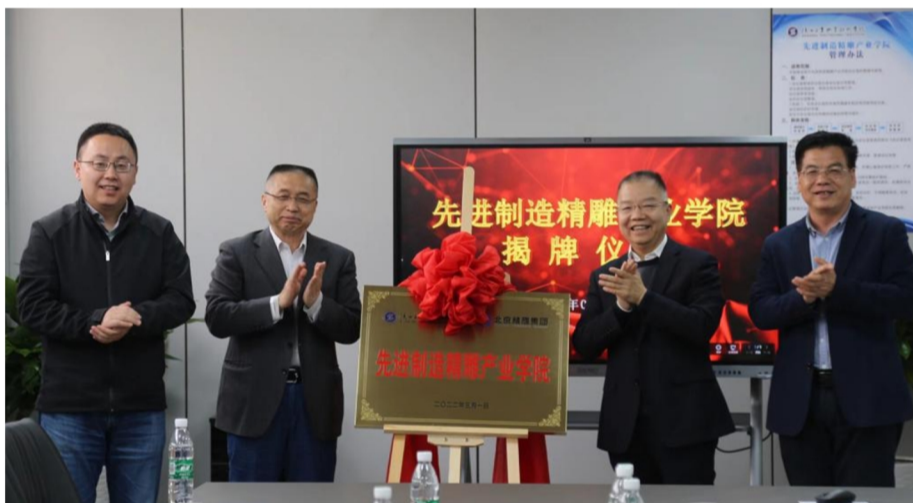
我校举行先进制造精雕产业学院揭牌仪式

最后，惠朝阳同志代表学校党委作表态发言。他表示，刘江南组长的点评很中肯，指出的问题都很到位，提出的希望很有温度，对学校下一步做好各项工作提供了一个基本遵循。领导班子和班子成员都要认真理解消化，对指出的问题要认真梳理总结，制订整改措施，确保专题民主生活会达到预期效果。在今后的工作中，学校一是要继续认真学习习近平总书记关于教育工作的安排部署，认真研究当前职业教育发展的重点任务，充分发挥校党委班子集体的作用，班子成员要切实履行一岗双责，牢固树立政治意识和全局意识，牢记自己党员的第一身份。二是要将党史学习教育作为我们未来学习教育的一个载体，总结和发扬我们党过去的优良传统，发扬斗争精神，进一步提高政治站位、业务能力和协作水平，在学校发展攻坚克难，爬坡过坎的这个关键时期，心往一处想，劲往一处使，推动实现学校的高质量发展。（组织部 罗宏）