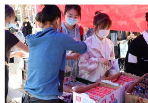
学校为考生提供简餐