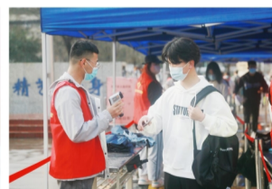
落实防疫要求，测量体温