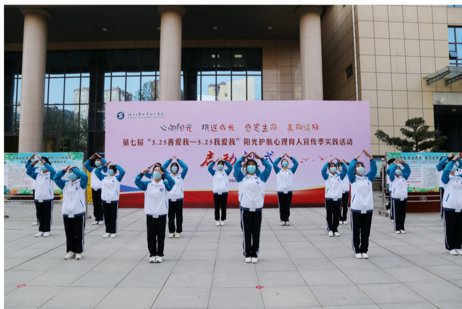
第七届阳光护航心理育人宣传季实践活动启动