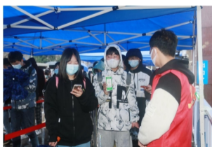
对考生健康码进行查验